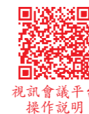
視訊會議平台操作說明